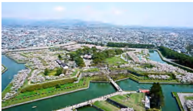
图三：函馆五棱郭公园全景，春假刚好可以赶上这日本最晚的樱花节（一般在 4.30-5.3 左右）

在公园赏樱野餐的文化~同时有巨大的分类垃圾箱，家庭野餐以冷食为主，青年野餐以烧烤为主。北海道樱花以白色为主，也是别有一番风味呢~