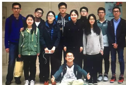
小品演员及幕后合影

小品以两位同学在宿舍玩游戏的场景开场，幽默风趣的对话让全场活跃起来；第二幕描绘了大学生放假回家的场景，随后的对话中逐渐显现出父母和孩子对朋友圈热闻不同的看法，贴近生活的同时不失诙谐幽默；最终大学生成功劝服父母远离朋友圈谣言，小品浅显易懂，寓意深刻，令观众们感同身受，激起共鸣。