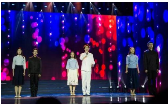
诗歌朗诵的精彩表演

在一个多月的时光里，统计人共同拼搏，在每一场比赛中全力发挥；尽情欢乐，用每一场精彩演出点亮青春记忆。在努力备战的日子里，学院党委领导和老师的鼓励和支持，也成为了最坚强的精神后盾。