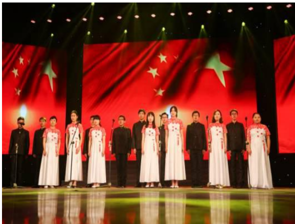
统计学院代表队演出中

本报讯 5月7日晚，中国人民大学第二十三届“五·四”文化艺术节声乐展演在如论讲堂隆重举行，由统计院校友及师生组成的代表队深情演绎一曲《在灿烂的阳光下》，向母校八十载华诞献礼。