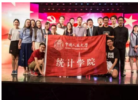
颁奖典礼合影留念

本次晚会还表彰了全校在团学工作中有突出表现的团支部及个人，统计学院2014级本科团支部荣获“五四红旗团支部”，2015级学硕团支部荣获“五四示范团支部”。