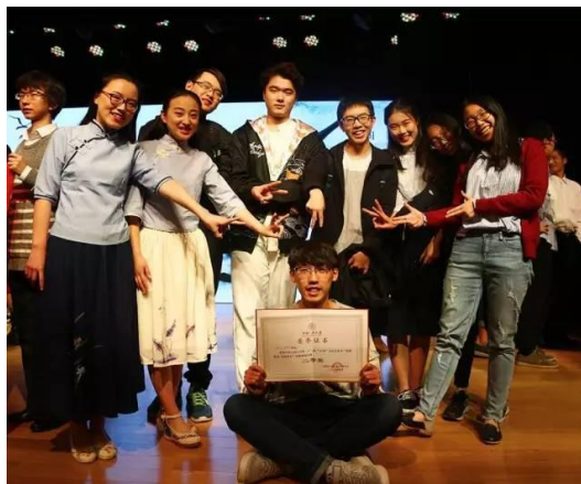
统计学院代表队成员合影

统计学院代表队的参赛作品是原创诗歌《人大·诗忆》。队员们运用丰沛的情感和熟练的技巧，于站立吟诵间，塑造出三个身处不同时代的人大弟子：从八十年前陕北公学的热血青年，到五十年代心怀梦想的懵懂儿童，到新的世纪回乡奉献的有志精英。六名同学将这些故事娓娓道来，情绪饱满的嗓音描绘出一幅幅栩栩如生的画面。每一个精心揣摩的表情，或追思，或激昂，每一个恰到好处的动作，或握拳，或挥手，将诗中的情绪渲染到了顶峰。八十载风华，在一行行诗句中流逝，不变的是一代代学子对人大热爱，是人大与祖国同命运共呼吸的坚守